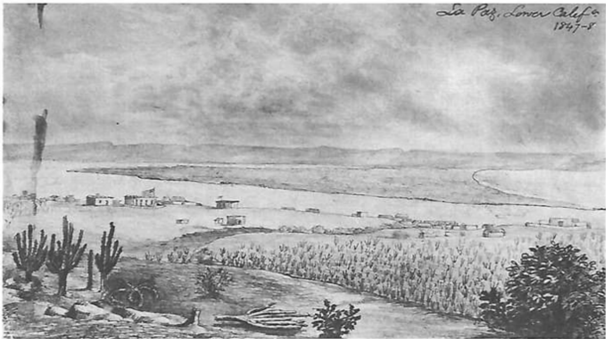
A view of La Paz in 1847-1848. To the far right are the abandoned ruins of the old Mexican fortification. On the far left are situated the buildings occupied by the U.S. Army Volunteers. The American flag is flying in front of the main building.

Con el paso del tiempo, la edificación ha sido restaurada y reutilizada. En los años 60, albergó la Escuela Técnica Industrial No. 27, y más tarde, tras ser reconstruida, se convirtió en el Cinema La Paz. Tras un período de abandono, el edificio ha vuelto a la vida como un centro de entretenimiento, conservando así su conexión con las generaciones actuales.